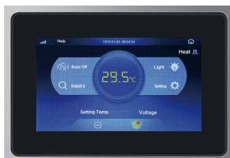
7 Inch LCD Screen