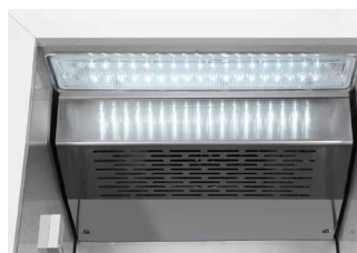
UV Sterilization Lamp