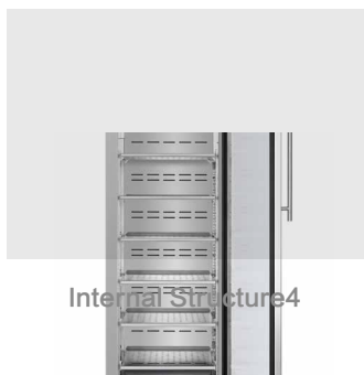
Internal Structure 4